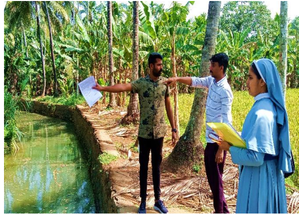
പദ്ധതിബാധിത പ്രദേശ സന്ദർശനം